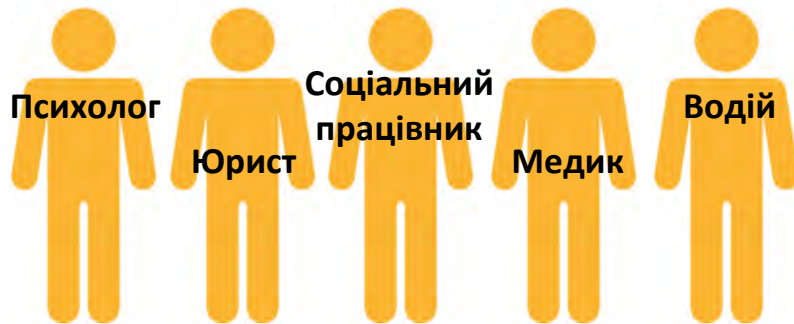
Мультидисциплінарна мобільна команда